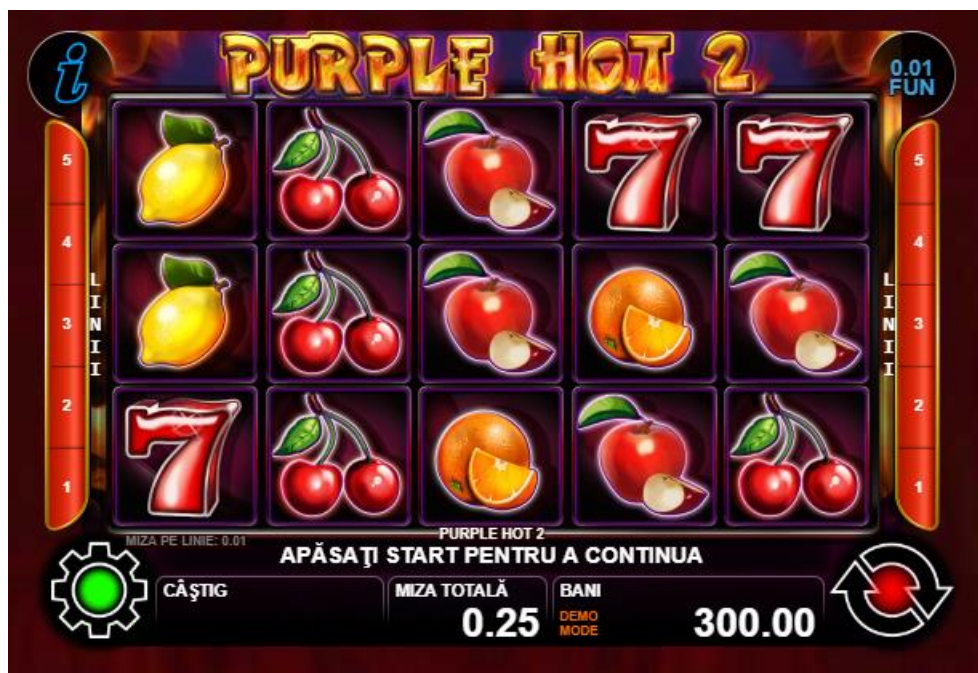
Fig. 2 Ecran al jocului principal