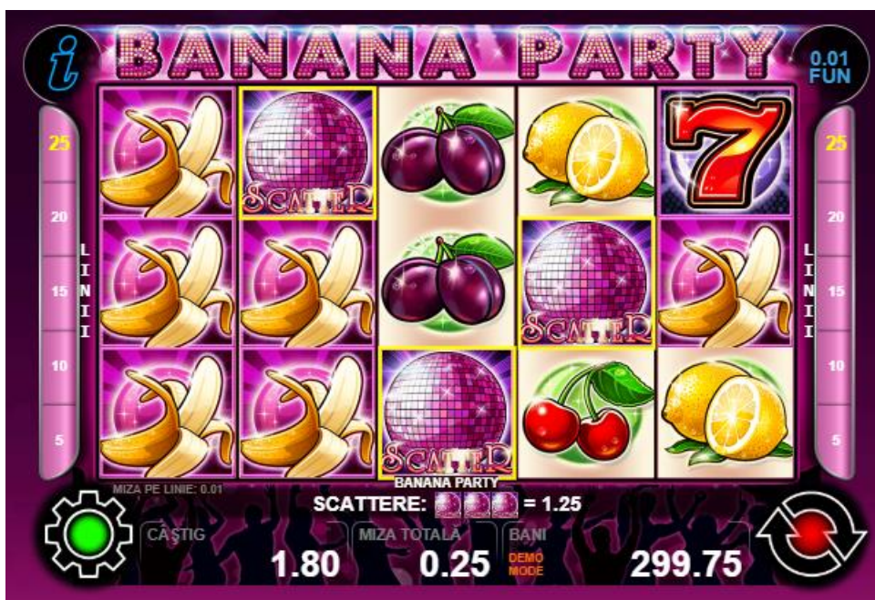
Fig. 3 Ecranul cu combinația câștigătoare cu participarea simbolului scatter

Simbolul „Stea” – participă în formarea câștigurilor de pânâ la 500 de ori pariul total și nu declanșează bonusuri.