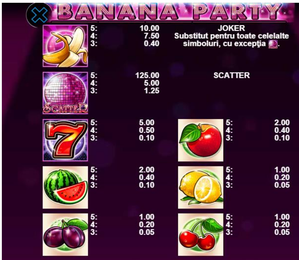
Fig. 1 Tabelul câștigurilor