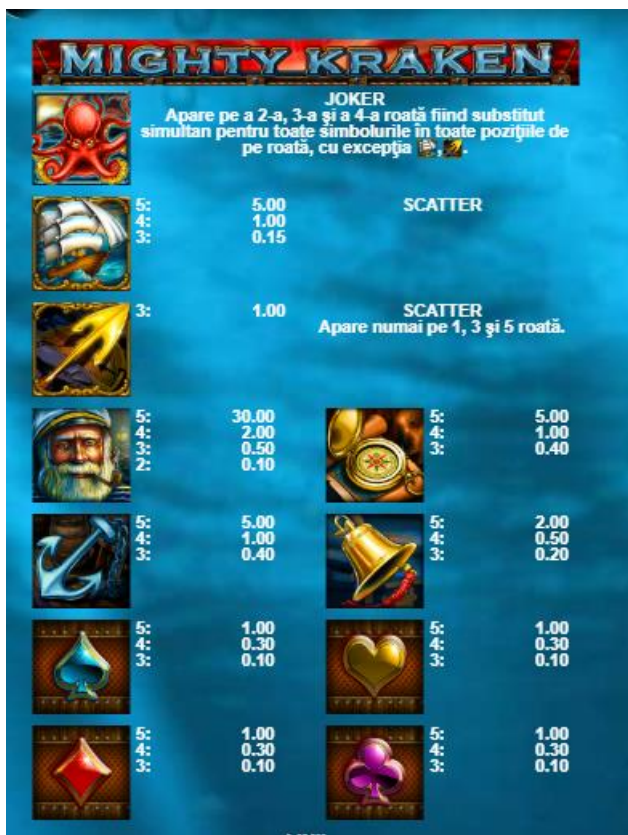
Fig. 1 Tabelul câștigurilor